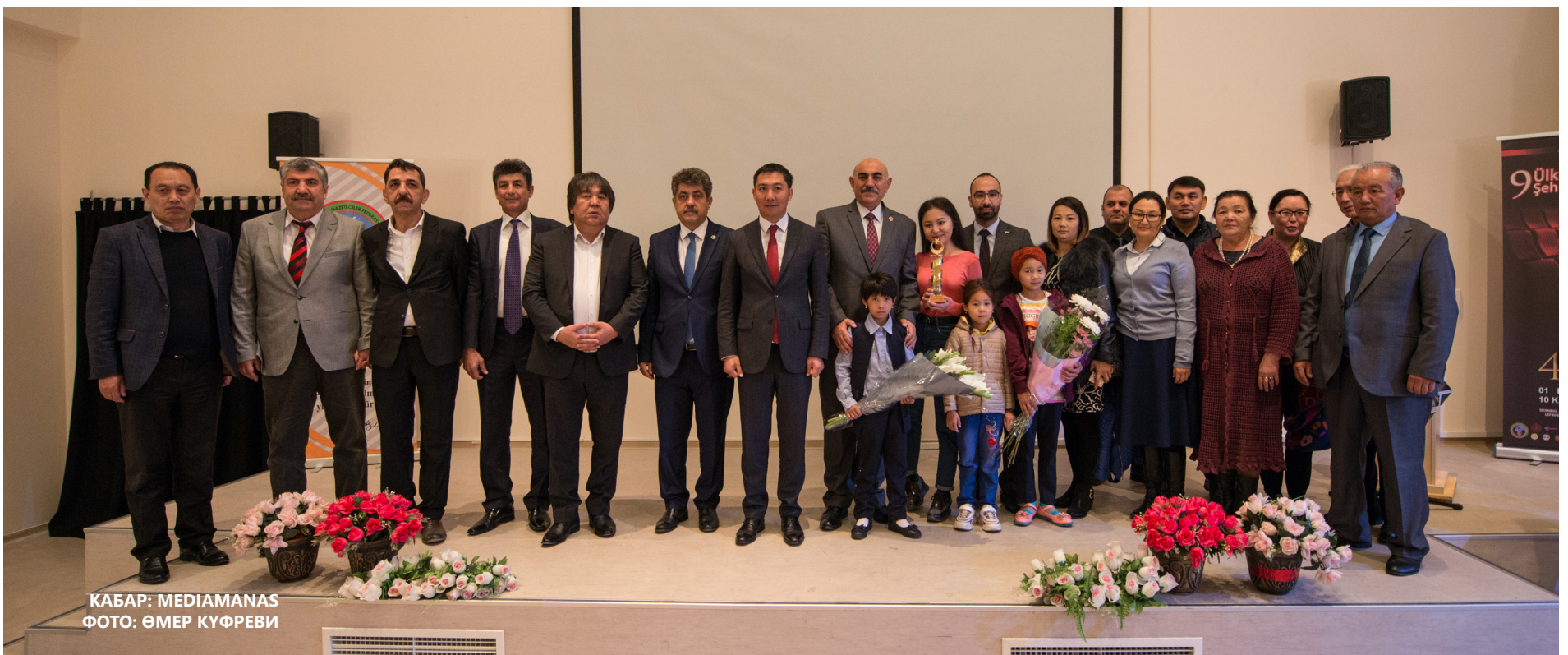
КАБАР: MEDIAMANAS