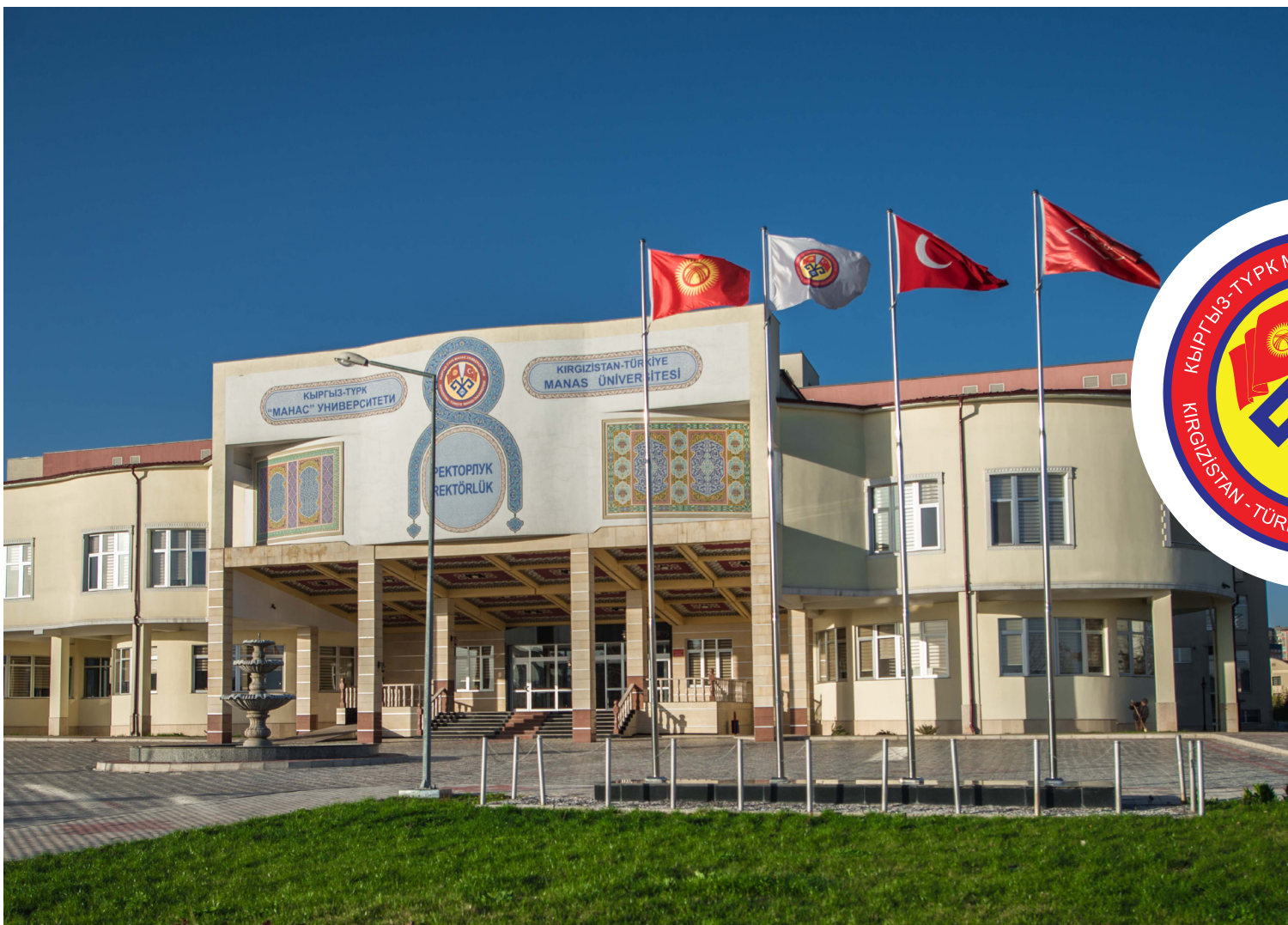
КАБАР: БАТУХАН АТЕШ БАТУХАН АТЕШ